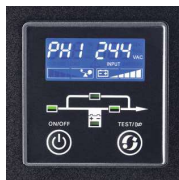
ЖК-дисплей для четкого отображения измерений и информации о статусе ИБП