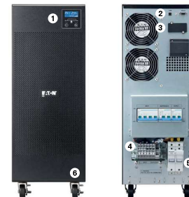
Eaton 9E 6Ki